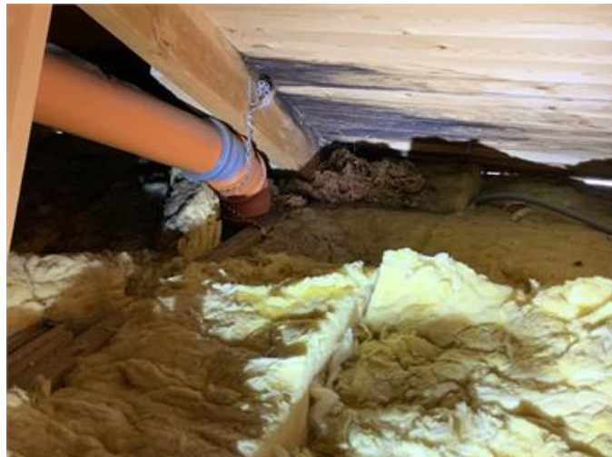
Fuktfläck på vinden.